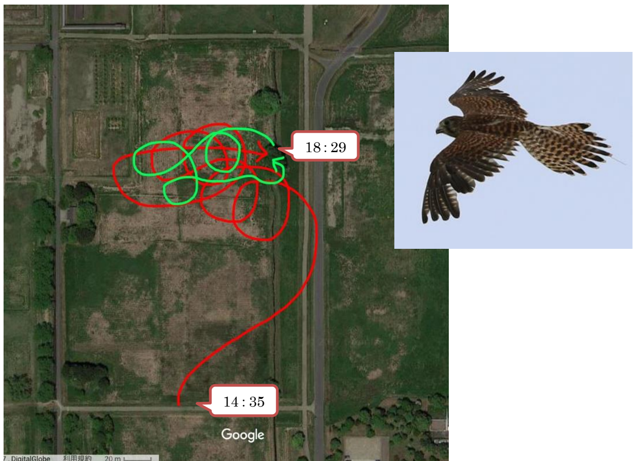
図 I 5/13 飛翔図

チョウゲンボウ1号は木の中を少しずつ移動していたが、そのまま日が暮れてそこで就寝となった。